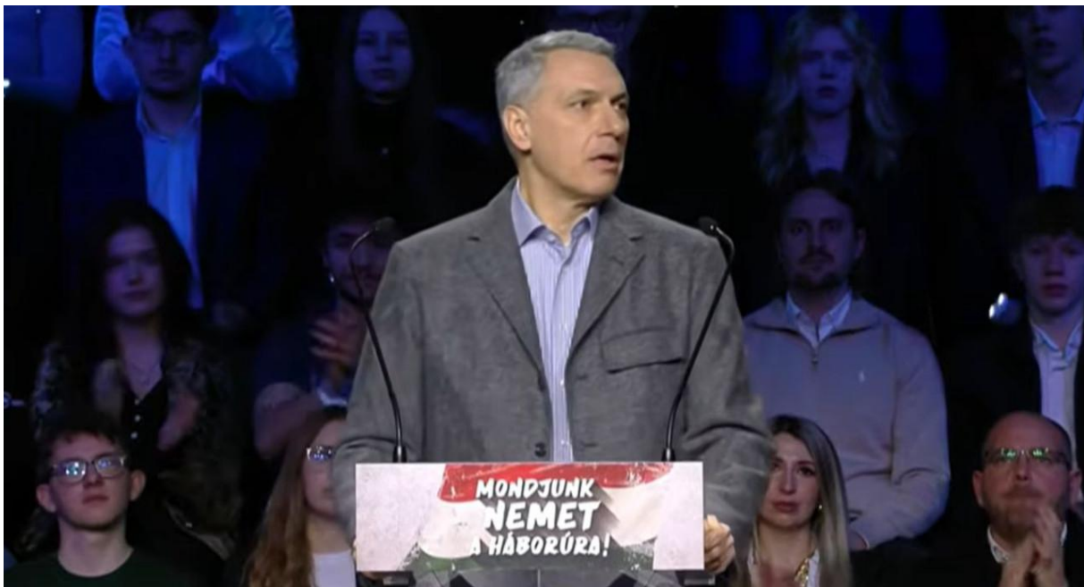
Lázár János Kaposváron

A miniszter azt mondta, ha a Tisza győz, mindenki veszít ebben az országban, akinek van valamije. Szerinte ők, fideszesek az egyetlen, valódi erővel rendelkező politikai közösség, amelyik az egyszerű emberek problémáival foglalkozik. Orbán Viktor a magyar vidék utolsó esélye szerinte, az egyedüli jó választás a vidéken élők számára. Nekik elmondása szerint nem Budapesttel van a bajuk, hanem azokkal, akik Budapest-országot akarnak felépíteni. Minél többet kap Budapest, annál kevesebb jut nektek, vidéken – fogalmazott. Szerinte a tiszások Budapestnek fognak forrásokat juttatni, és ha a Tisza lesz kormányon, a vidéknek kuss lesz a neve. A rózsadombi tiszások szerinte lenézik, lesajnálják a magyar parasztokat. A Somogy megyei fiataloknak kell esélyt teremteni szerinte. Hajrá, Somogy, hajrá, Magyarország, hajrá, Orbán Viktor – adta át a színpadot a kormányfőnek.